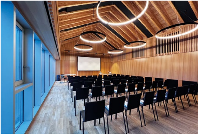
L'Auditorium Casa Cavalier Pellanda