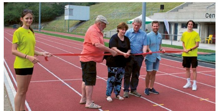
Il taglio del nastro al Vallone

Le attività libere sono state gestite da associazioni e gruppi sportivi o di intrattenimento locali. Lo scopo è stato anche quello di offrire una piattaforma dove le varie società potessero presentarsi e farsi conoscere dai cittadini di Biasca e non solo. Ogni gruppo ha avuto la propria postazione all'interno del Centro Sportivo.