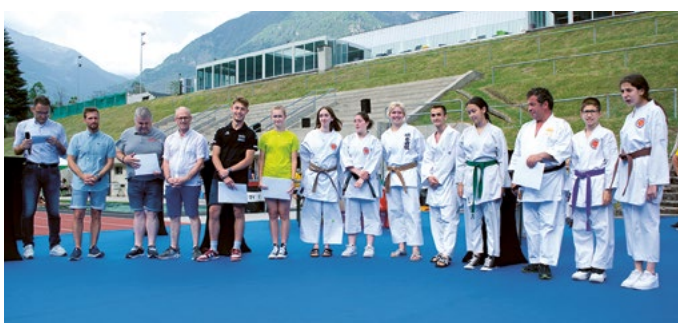
I migliori sportivi di Biasca 2022