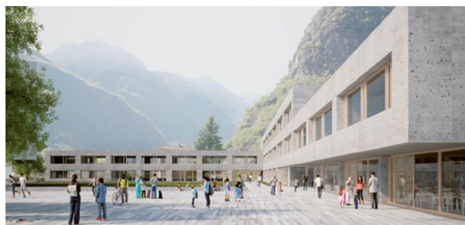
La piazza in Bosciorina

Contemporaneamente, anche il Cantone necessitava di ottenere delle soluzioni per le sue scuole in località Quinta. Tale particolare congiuntura ha determinato la richiesta di un credito al Consiglio comunale con Messaggio Municipale no. 11-2018 per l'avvio di un'unica