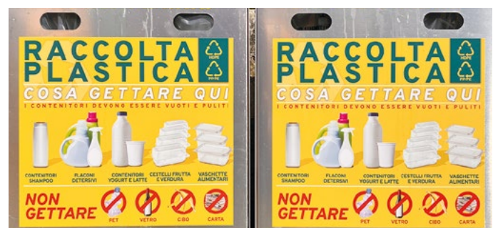
Lo smaltimento delle plastiche

Si ricorda che quasi tutti i centri commerciali, sul nostro territorio, offrono la stessa possibilità solitamente collocata all'entrata.