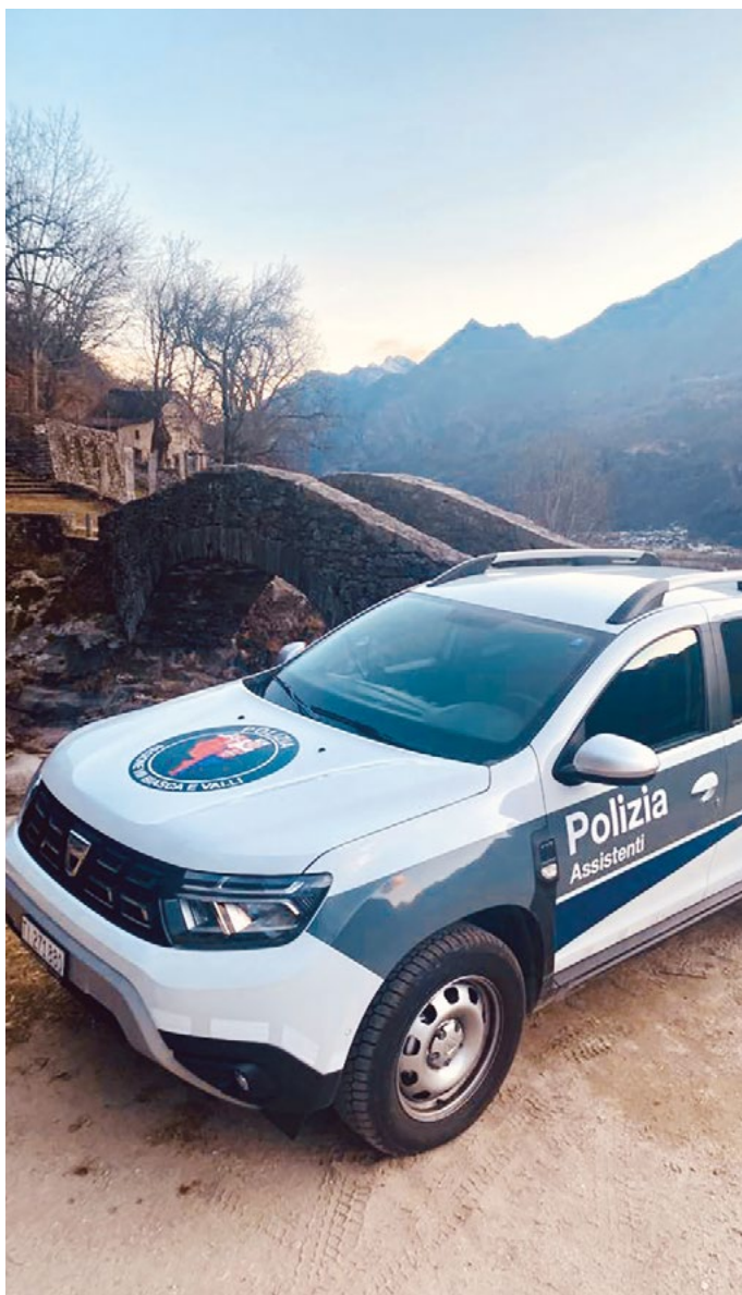
Il veicolo degli assistenti di Polizia 3 Valli

Gli assistenti sono a disposizione di tutti i Comuni delle Tre Valli per l'espletamento di compiti particolari. Gli assistenti hanno seguito il corso di formazione per l'ottenimento della qualifica.