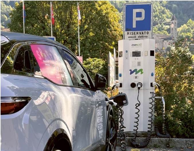
Le colonnine piazzale ex-UBS

dei costi d'investimento nei tempi calcolati di sette anni. Tuttavia l'occupazione per ora ancora bassa è in aumento.