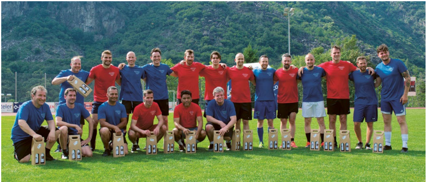
Le squadre dei Politici e degli Sportivi

Oltre alle attività sportive, sono state proposte delle tavole rotonde con la partecipazione di ospiti competenti e professionali, nonché esperti del tema.