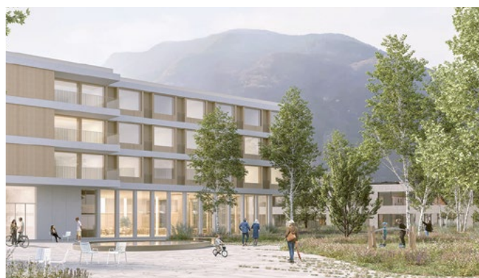
La nuova Casa Anziani in Bosciorina

Dopo la ripresa economica fatta registrare nel 2021, il rafforzamento della congiuntura è stato messo a dura prova ad inizio 2022 dal preoccupante conflitto in Ucraina. La contrazione del PIL tutto sommato limitata del 2.4% nel 2020, nel 2021 ha registrato un forte rimbalzo del +4.2%. Dopo uno scoppiettante inizio di 2022, nel 3° trimestre si è registrato un rallentamento (+0.2%) e il 4° trimestre ha frenato ulteriormente portando l'economia svizzera in una situazione di stagnazione. Complessivamente la crescita del PIL 2022 risulta di +2.1%. L'inflazione è cresciuta in modo repentino, in particolare con un aumento dei prezzi dei beni alimentari e dell'energia, che ha