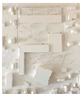
Il Comparto Bosciorina

L'augurio è che le informazioni di questa edizione possano suscitare il vostro interesse e dimostrarvi quanto il nostro Comune è più attivo e vivo che mai.