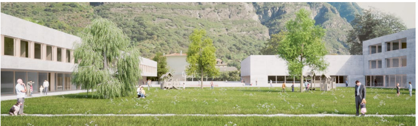
Il Parco della Scuola

I volumi definiscono in modo chiaro tre spazi esterni principali, un parco pubblico con una parte privata per la Casa anziani, uno per la Scuola elementare (anche pubblico) e uno ad uso esclusivo per la Scuola dell'infanzia. Gli spazi esterni aperti al pubblico sono collegati tra di loro e al tessuto residenziale limitrofo tramite portici e collegamenti pedonali. La disposizione in linea dei posteggi lungo via Lepori permette di limitare al massimo lo spazio dedicato ai veicoli a motore favorendo i pedoni e la mobilità lenta.