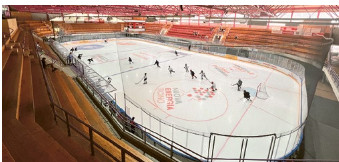
La pista di ghiaccio Biascarena

La Pista di Ghiaccio è un'importante struttura comunale per la pratica sportiva dei nostri giovani. Questo sport invernale molto praticato nella nostra regione anche grazie alla squadra faro di Lega Nazionale A dell'HCAP