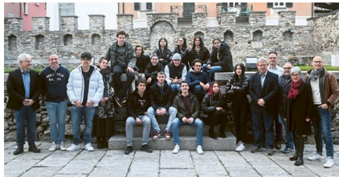
I maggiorenni di Biasca 2023

Ospite della serata è stato l'allenatore del FC Lugano Mattia Croci Torti che, durante il suo discorso, oltre a indicare fatti legati alla sua carriera sportiva ha ricordato ai giovani l'importanza di osare in ogni cosa che fanno senza paura di sbagliare.