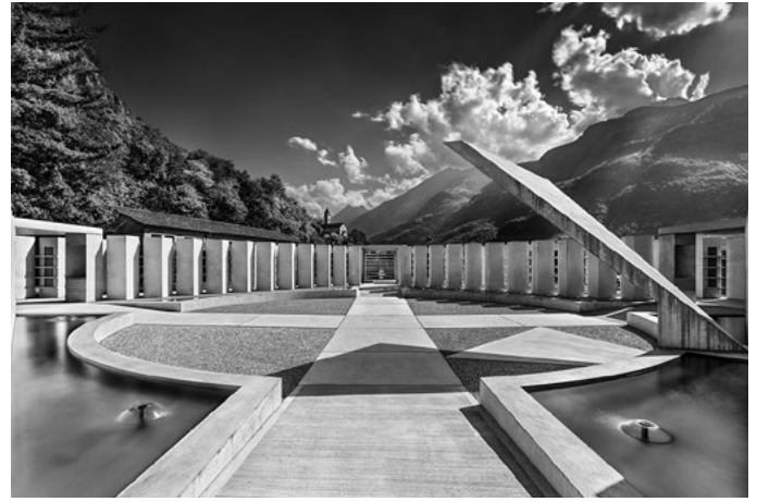
L'ampliamento del Cimitero

GiocoForza la Banca nazionale è dovuta intervenire sul tasso d'interesse di riferimento allo scopo di contenere l'inflazione e limitare la volatilità del franco svizzero e nel contempo sostenere la ripresa economica.