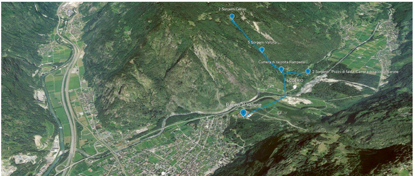
Dal Bacino al Vallone attraverso le condotte l'acqua arriva nelle case di Biasca

Negli ultimi 2 anni si è abbassata di 3 metri. Per i professionisti, gli artigiani, le industrie, gli agricoltori e gli